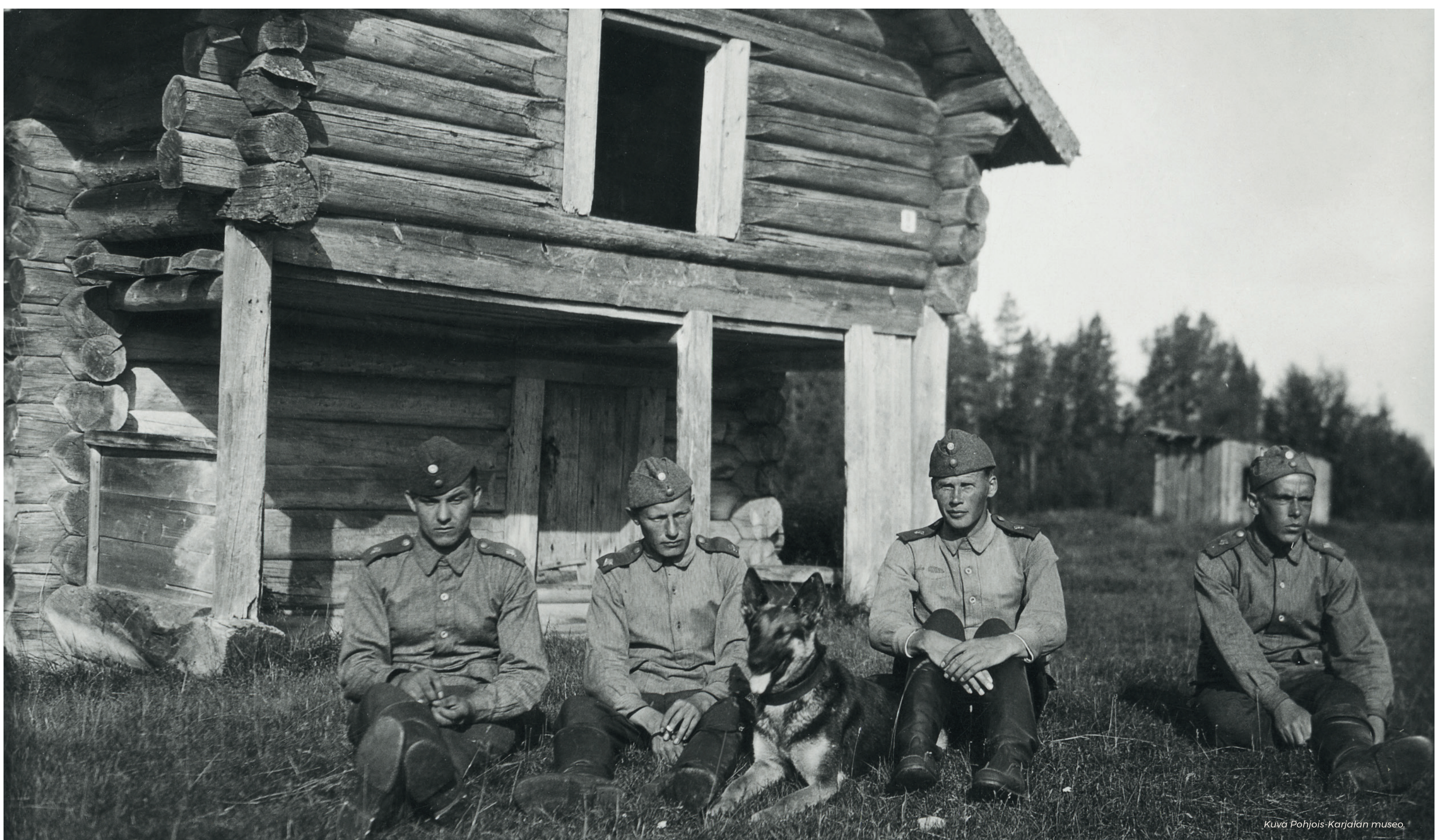
Megrin vartion rajamiehiä ja rajakoira vuonna 1931. Vartio sijaitsi valtion omistukseen siirtyneessä entisessä luostarissa Megrijärven rannalla.

Ennen talvisotaa Ilomantsin rajakomppaniolla oli seitsemän vartioasemaa, joista sodan jälkeen luovutetulla alueella sijaitsivat Jyrkkäkoski, Pahkalampi, Megri, Kuolismaa ja Salmijärvi. Rajamiesten tehtävänä oli rajavartioiden lisäksi muun muassa tarkastaa kuukausittain savotakämpät ilman passia ja lupaa olevien ihmisten varalta.